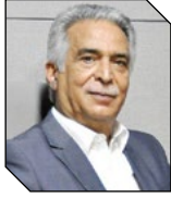
محمد رضا بهرام رئیس خانه معدن ایران

از سال ۱۴۰۰ تلاش‌های بسیاری برای حل مشکلات موجود در تامین مواد ناریه انجام شده است، اما به دلیل انحصار تولید و ملاحظات امنیتی، تاکنون نتیجه‌ای حاصل نشده است. افزایش چشمگیر قیمت مواد ناریه در سال‌های اخیر، مشکلات بخش معدن را تشدید کرده است. با توجه به این شرایط، تحقق هدف رشد ۱۳ درصدی بخش معدن در برنامه هفتم توسعه، با چالش جدی مواجه است. فارغ از این موضوع، آزادسازی بلوکه‌ها، پهنه‌ها و مزایده معادن منجمد یکی از کلیدهای اصلی تحقق رشد ۱۳ درصدی بخش معدن در برنامه هفتم توسعه است. اما برای رسیدن به این هدف چه اقداماتی باید انجام شود؟ قطعاً ایجاد شفافیت و تسهیل فرآیندهای سرمایه‌گذاری در بخش معدن از اقدامات تاثیرگذار در این زمینه است.