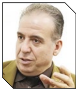
مجید رضا حریری رئیس اتاق مشترک ایران و چین

از سال ۱۴۰۰ تلاش‌های بسیاری برای حل مشکلات موجود در تامین مواد ناریه انجام شده است، اما به دلیل انحصار تولید و ملاحظات امنیتی، تاکنون نتیجه‌ای حاصل نشده است. افزایش چشمگیر قیمت مواد ناریه در سال‌های اخیر، مشکلات بخش معدن را تشدید کرده است. با توجه به این شرایط، تحقق هدف رشد ۱۳ درصدی بخش معدن در برنامه هفتم توسعه، با چالش جدی مواجه است. فارغ از این موضوع، آزادسازی بلوکه‌ها، پهنه‌ها و مزایده معادن منجمد یکی از کلیدهای اصلی تحقق رشد ۱۳ درصدی بخش معدن در برنامه هفتم توسعه است. اما برای رسیدن به این هدف چه اقداماتی باید انجام شود؟ قطعاً ایجاد شفافیت و تسهیل فرآیندهای سرمایه‌گذاری در بخش معدن از اقدامات تاثیرگذار در این زمینه است.