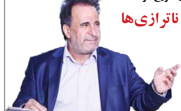
استمرار خواهد داشت و چه‌بسا سال آینده با تعطیلی نسبتاً کامل صنعت حتی گاز و برق کافی برای مصرف منازل هم وجود نداشته باشد.

اینکه روی اقیانوسی از نفت و گاز قرار داشته باشی اما در تأمین انرژی برای روشنایی و گرم کردن خانه‌های خود در قرن ۲۱ مشکل داشته باشی شاهکاری بی‌بدیل در حکمرانی است که باید در کتاب‌های رکوردهای گینس ثبت شود، این ناترازی در کوتاه مدت با واردات و در بلندمدت با سرمایه‌گذاری خارجی مقدور است که نه فعلاً پولی برای واردات موجود است و نه به دلیل وجود تحریم‌های بی‌پایان و سیاست خارجی موجود رغبتی در سرمایه‌گذار خارجی برای این کار وجود دارد.