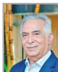
محمد رضا بهرامی رئیس خانه معدن ایران

فعالان حوزه معدن همواره از این موهبت الهی به عنوان بهترین راه برای برون‌رفت از بسیاری از چالش‌های اقتصادی کشور یاد می‌کنند اما معتقدند این بخش با این حجم از قابلیت هیچگاه آنطور که باید مورد بهره‌برداری قرار نگرفته است اما یکم خردادماه بهترین فرصت است برای پرداختن به معدن و معدنکاری و بررسی چالش‌های این حوزه‌ی ارزشمند. هیات دولت در سال ۱۳۶۷، با توجه به ظرفیت و ساختار خاص زمین‌شناسی کشور، یکم خردادماه را روز معدن نامگذاری کرد و متعاقباً بر اساس مصوبه شورای عالی انقلاب فرهنگی در سال ۱۳۷۹، دهم تیرماه روز صنعت و معدن نامیده شد. بی‌تردید اما امروز، ۴۴ درصد از چالش‌های بخش معدن کشور مربوط به قوانین، آئین‌نامه‌ها و مقررات تعریف شده توسط حکمرانی دولت و نبود یک راهبرد طولانی و مشخص معدنی، و الباقی به سوءمدیریت و مشکلات معدن‌داران و معضلات محیط زیستی و منابع طبیعی مربوط است و در شرایط کنونی تنها ۱۰