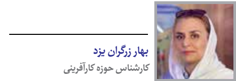
بهار زرگان یزد

بهره‌برداری از فرصت به ساخت عملیات کارا و تمام عیار برای محصولات و خدمات شناسایی شده توسط یا مشتق شده از یک فرصت تجاری گفته می‌شود. برای بیشتر کارآفرینان بهره‌برداری از فرصت یک گام ضروری جهت تولید درآمد و بنابراین خلق یک کسب‌وکار موفق است. بنابراین فرآیند کسب‌وکار با کشف یک فرصت تجاری آغاز می‌شود. حین دوره اکتشاف، کارآفرینان تلاش می‌کنند تا بی‌اطلاعی خود را درباره فناوری و بازار با